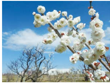
令和5年度区長賞受賞作品

御幸公園と梅の魅力発信の一環として梅に関する写真(梅の花、果実、梅林、梅にちなんだ祭りの風景など)を募集します。撮影場所は問いません。応募作品は、区役所と日吉出張所で4月～5月に展示します。優秀作品は表彰します。区内で撮影された作品が区長賞として表彰された場合は3月発行の「さいわいガイドマップ」に掲載します。