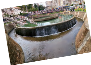
「水の遺産」 村松 郁夫