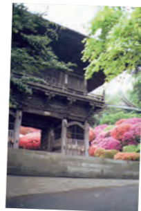
「つつじ寺」 山根 清貴