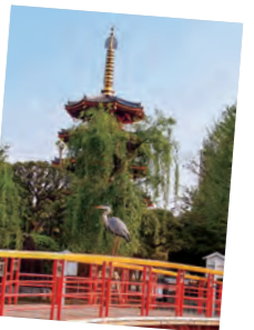
「牛若丸の如き」 野村 茂