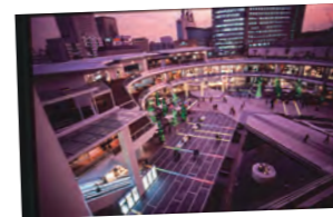
「ラゾーナ暮景」 江口 聡