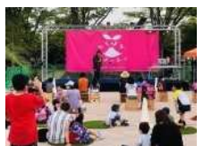
地域のやりたいを叶えることができる地域の個性があふれる公園に