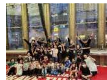
脱炭素や音楽、若者文化など、川崎の得意分野を伸ばし、より魅力的なまちに