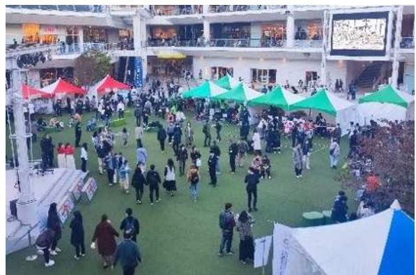
屋外での賑わいイベントと連携した誰もが楽しめる「フェスティバル」を実施