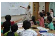
川崎を知って関わって好きになることもたち増加

川崎を知って、関わって、好きになる記念事業の実施により、市民一人ひとりのシビックプライドの醸成を図るとともに、自らまちに関わり、まちを盛り上げる市民、企業、団体の方々の増加を目指します。