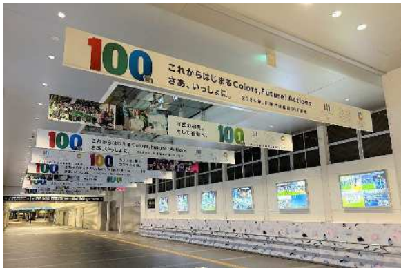
主要駅ドレッシングのイメージ