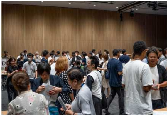
実行委員参画団体の交流や共創を促す交流会