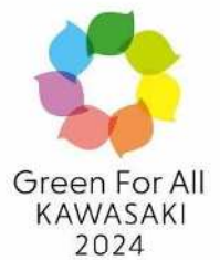
第41回 全国都市緑化かわさきフェア シンボルマーク