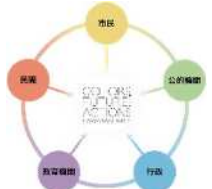
共創による新たなかけ合わせが生まれやすい機運を醸成

100周年を契機として生まれたつながりや多様な主体が力を掛け合わせて生まれたActionを、次の100年に向けて活かし育てながら、川崎を持続的に発展させていくことを目指します。