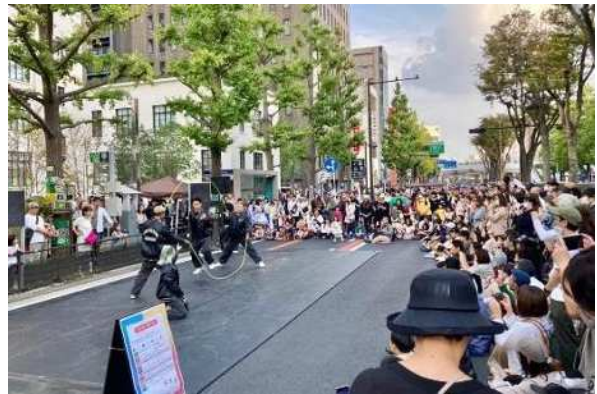
さまざまな主体と連携しながら、川崎の魅力あるコンテンツを集結

市制記念日直前の土曜日である令和6年6月29日、川崎の多様なプレーヤーとの連携により、等々力緑地をフル活用した、川崎の魅力や価値に触れる祝賀イベント「(仮称)かわさき飛躍祭」を実施します。