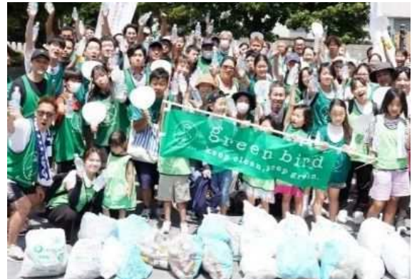
グリーンバード川崎駅チームとスターバックス コーヒー 川崎地区のパートナー同士による、市制100周年に向けて100人で行う清掃活動