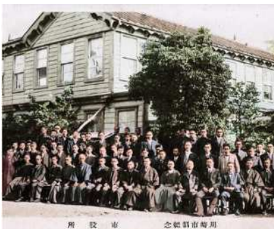
川崎町・御幸村・大師町を合併し、川崎市誕生

川崎市は、 大正13(1924)年に市制がスタート。 人口約5万人から始まった川崎市は、 工業都市としての発展や環境問題などを経て、 政令指定都市として6番目の人口を擁する大都市へと成長しました。 現在でも、多くの産業が集積し、音楽・スポーツ・文化など 多彩な魅力を有する活力ある都市として、今、なお成長を続けています。