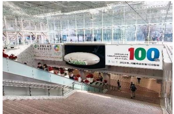
さまざまな企業・団体等と連携して展開