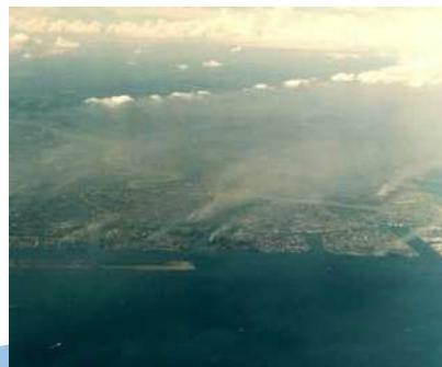
1960年代の川崎臨海部工業地帯