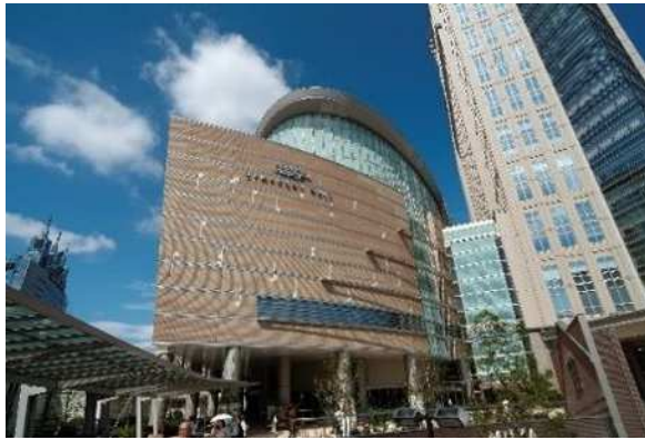
ミュージア川崎シンフォニーホールに来賓や表彰される方をご招待

式典では、記念映像の上映や、混声合唱に混成オーケストラ、市の発展に寄与された方等への表彰など、市制100周年記念事業のコンセプトであり、市ブランドメッセージである「Colors,Future! いろいろって、未来。」が感じられる演出を行い、川崎の魅力や歴史を再確認するとともにシビックプライドを醸成する機会とします。