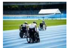
障がいの有無など関係なくより誰もが暮らしやすいまちに