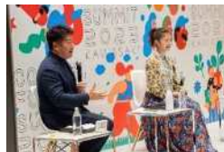
100周年を機に生まれた事業「Colors,Future! Summit」「みんなの川崎祭」などの事業の継続・発展