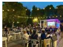
車道の活用や通りのライトアップなどにより公共空間の活用が加速

100周年を機にチャレンジすることで、さまざまな分野の取組を加速させることを目指します。