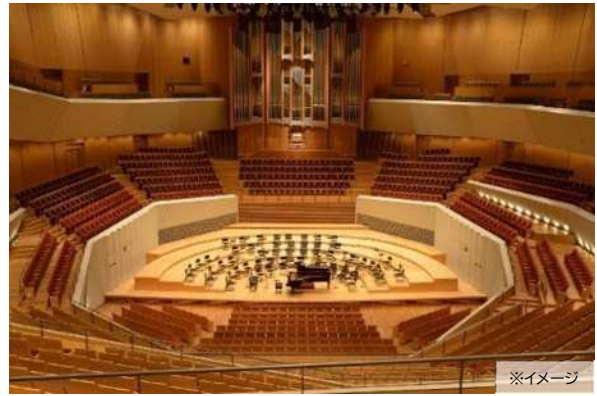
混声合唱×混成オーケストラによる「多様性は可能性」を体現する演奏