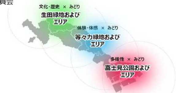
3つのコア会場およびエリアのコンセプト