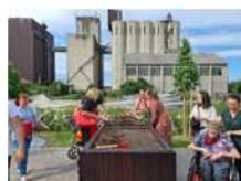
日常の中にみどりが溶け込み、みどりを通してつながりを生み出す