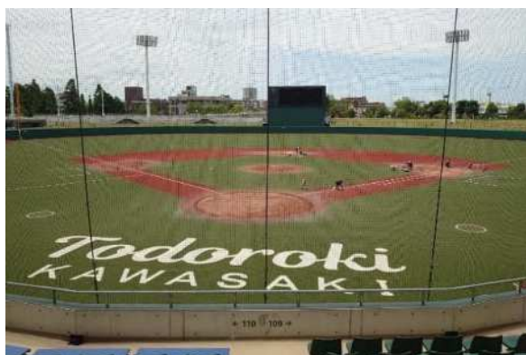
等々力球場での音楽フェス開催は初めての試み

川崎が誇る魅力をイベント化し、川崎ゆかりのアーティストによる音楽フェス、川崎が誇る魅力的なコンテンツを活かしたイベントなどを、等々力緑地全体で実施し、市制100周年を盛り上げます。