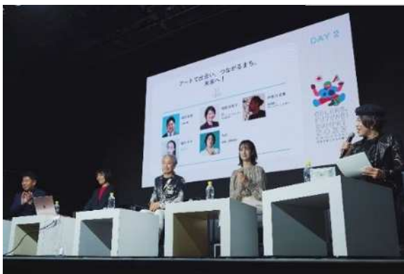
川崎にゆかりのある方や有識者を招いて「あたらしい川崎」の可能性を深掘り