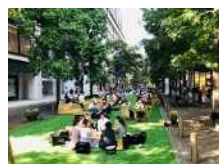
日常的に憩い、集い、賑わうみどりとオープンスペースを創出

フェアをきっかけに、市民、団体、企業等の多様な主体との協働・共創により、日常的に憩い、集い、賑わう質の高いみどりとオープンスペースを創出するとともに、日常の暮らしの中にみどりが溶け込み、みどりを通して、人と人、人とまちのつながりを生み出すことを目指します。