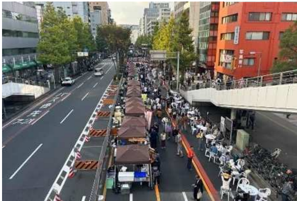
飲食・休憩スペースを道路に設置し、ウォークアブルな空間を創出