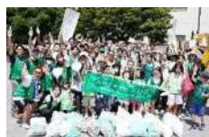
自らまちに関わり、まちを盛り上げる市民等が増加