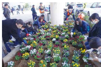
▲5年12月に教育文化会館前で開催した時の様子

6年度に開催する全国都市緑化かわさきフェアをきっかけに、公園・緑地の担い手を次の世代につなげるため、公園緑地愛護会と協力し、区内の高校生・大学生などに公園・緑地の活動を体験してもらい取り組みを行っています。