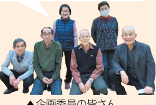
▲企画委員の皆さん