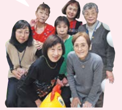
▲カフェスタッフの皆さん