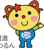
かわさき3R推進 キャラクターかわるん