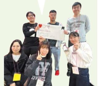
▲カワハル企画部の皆さん