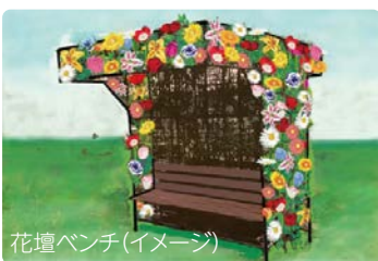
花壇ベンチ(イメージ)