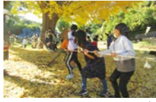
多摩区こどもの外遊び交流事業

地域全体で子どもを見守り、子育て世代を地域で支え、安心して子育てできる環境づくりを進めます。