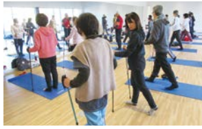
ポールウォーキング&ストレッチ教室

「ピクニックタウン多摩区」をキーワードにした魅力発信、音楽や区のスポーツ資源である「Anker フロントウ生田」など地域の特性を生かした取り組みを推進するとともに、市制100周年を契機とした取り組みなどを実施します。