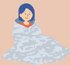
非常用防寒ブランケット