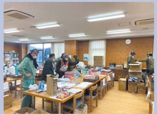
救援物資の仕分け

災害支援に従事した地区では、地震後、しばらくの期間、停電、断水状態で生活への負担は大きいものでした。救援物資については、発災直後は食料や防寒具が最も必要とされていましたが、私が従事した地震から16~20日ほど経過した頃には、下着類や衛生用品が必要とされるなど現場での物資のニーズは常に変っていました。今回の震災を踏まえて各家庭で今一度身の回りの備えを見直してもらいたいと思います。