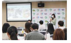
大学生の地域参加促進事業(たまなび)

地域の人や関係団体、区にゆかりのある大学など、多様な主体と一緒に、課題解決やコミュニティの活性化を進めます。