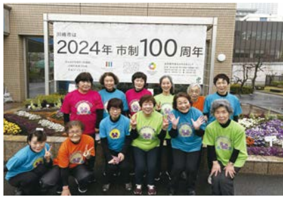
なかはらパンジー隊と一緒に体操します