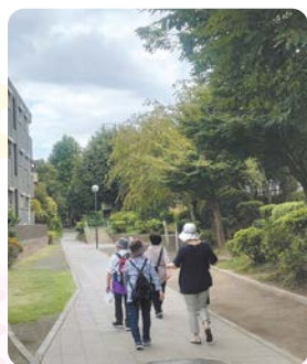
おしゃべりしながら歩きます