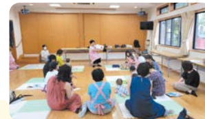
誰もがほっとできる時間を過ごしています

「子育てはみんなの力で」が合言葉。遊びや行事を通じて保護者同士の出会いの場、地域のことを知るきっかけの場でもあります。