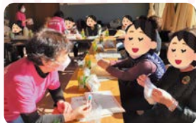
ご自宅の汁物の塩分をチェック

親子向け、男性向け料理教室を通じた健康づくりやシニアカフェなどでつながりの場をつくらせています。「食改さん」の育成も行っています。