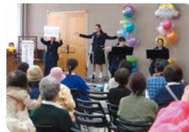
いろいろな年代の人が楽しめます

なかはら子ども未来フェスタ、なかはら福祉健康まつりなど、ふらっと参加できる身近な催しがたくさんあります。