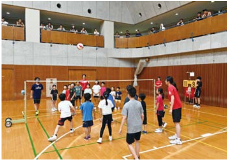
現役選手が直接教えてくれます