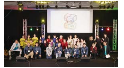
区民手作りのイベントです