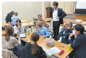
あなたの「やりたい」を応援中

地域の人たちが主体となって、つながりや新たな活動を生み出すための取り組みを行っています。