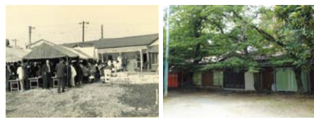
二子老人いこいの家(左:昭和46年、右:現在)