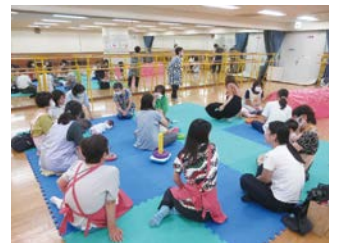
ふれあい子育てサロン「きらり」の様子

区内には町内会や自治会から推薦された民生委員児童委員が195名います。民生委員児童委員は主に私たちの生活の中での困りごとなどの相談窓口として活動しています。高齢者の介護や子育ての悩みなど困っていることがあればご相談ください。また、高齢者や乳幼児向けのサロンも開催していますので、お住いの地区の民生委員児童委員にお問い合わせください。