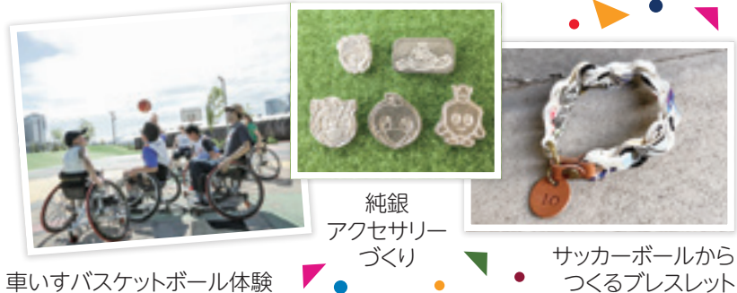
車いすバスケットボール体験 ● 純銀 アクセサリーづくり ● サッカーボールからつくるプレスレット

川崎フロンターレ(サッカー)と一緒にSDGsを学び、体験できるイベントを開催します。現役選手と交流しながら車いすバスケットボール、車いすラグビーの体験ができるコーナーや、ごみの分別を学びながらゴールキックに挑戦する「キックターゲット」、リサイクルされた銀を使ったアクセサリーづくり、太陽光発電で走るミニカーづくり、使わなくなったサッカーボールを利用したプレスレットづくりのコーナーなど盛りだくさんです。 ◎6月2日(日)13時半～16時半。荒天中止 〇Uvanceとどろきスタジアム by Fujitsu周辺 〇環境局脱炭素戦略推進室 ☎044-200-3871 FAX044-200-3921 ※当日先着や費用がかかるイベントもあります。