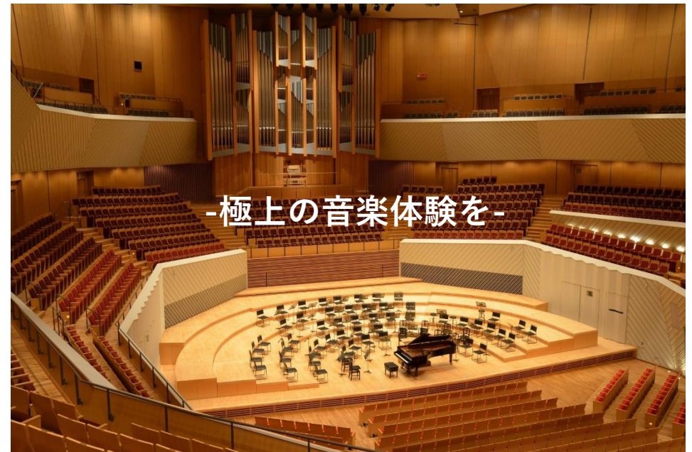
CCBY4.0 by ミューザ川崎シンフォニーホール