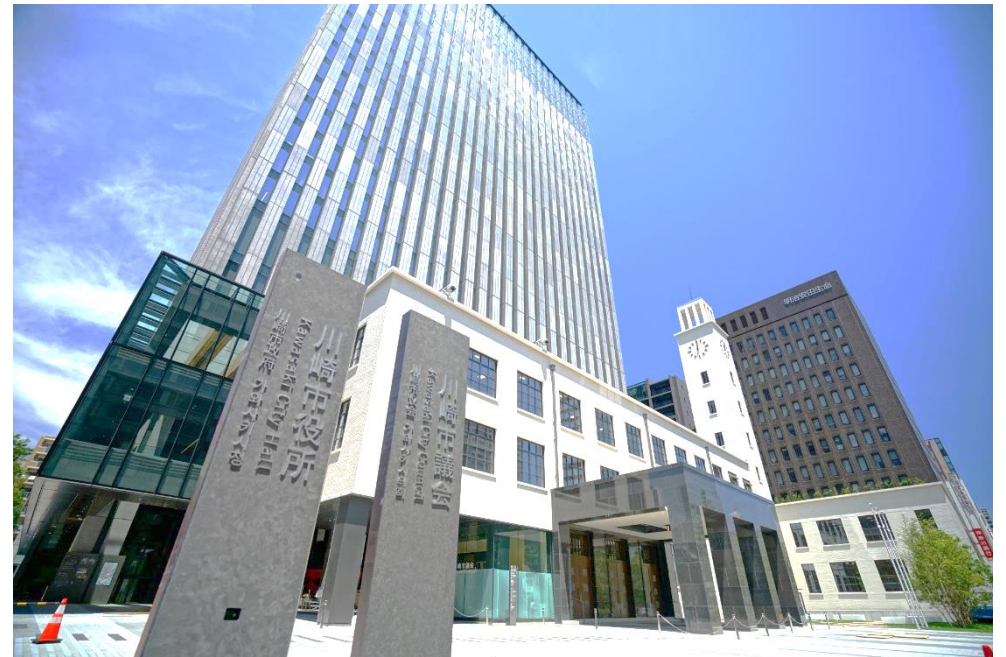
提供写真を改変して利用しています。CCBY4.0 by 川崎市