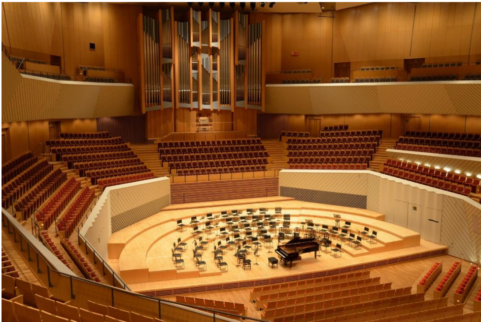
CCBY4.0 by ミューザ川崎シンフォニーホール