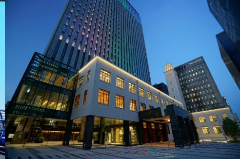
CCBY4.0 by 川崎市