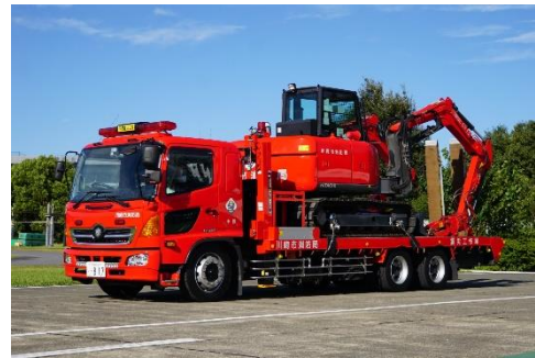
CCBY4.0 by 川崎市