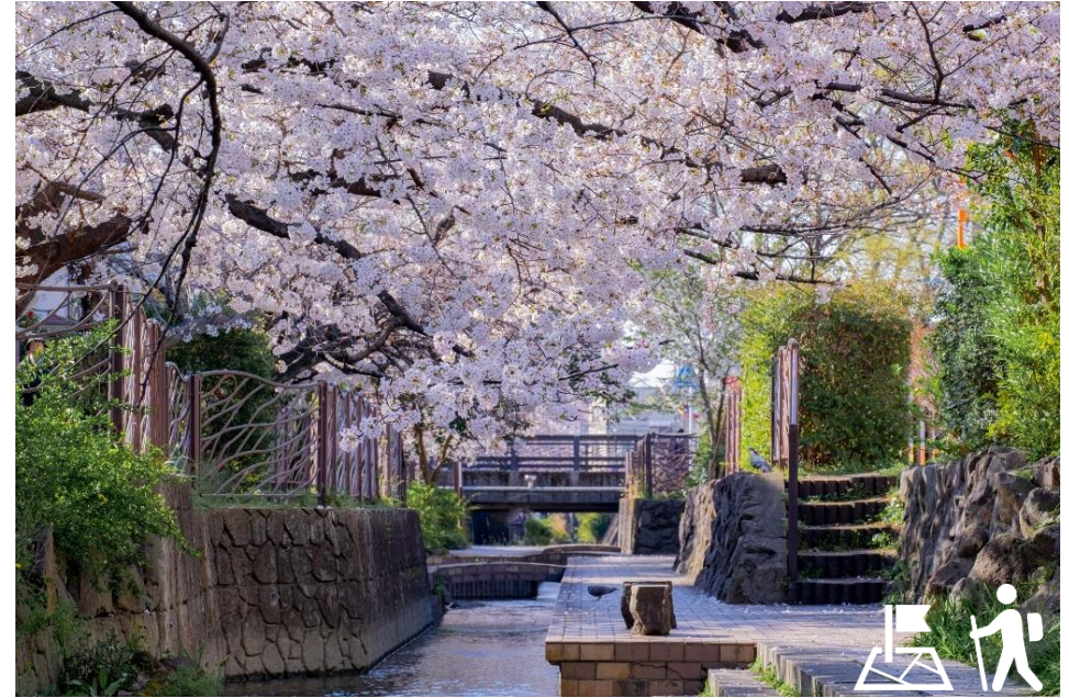
写真の上にイラストを配置