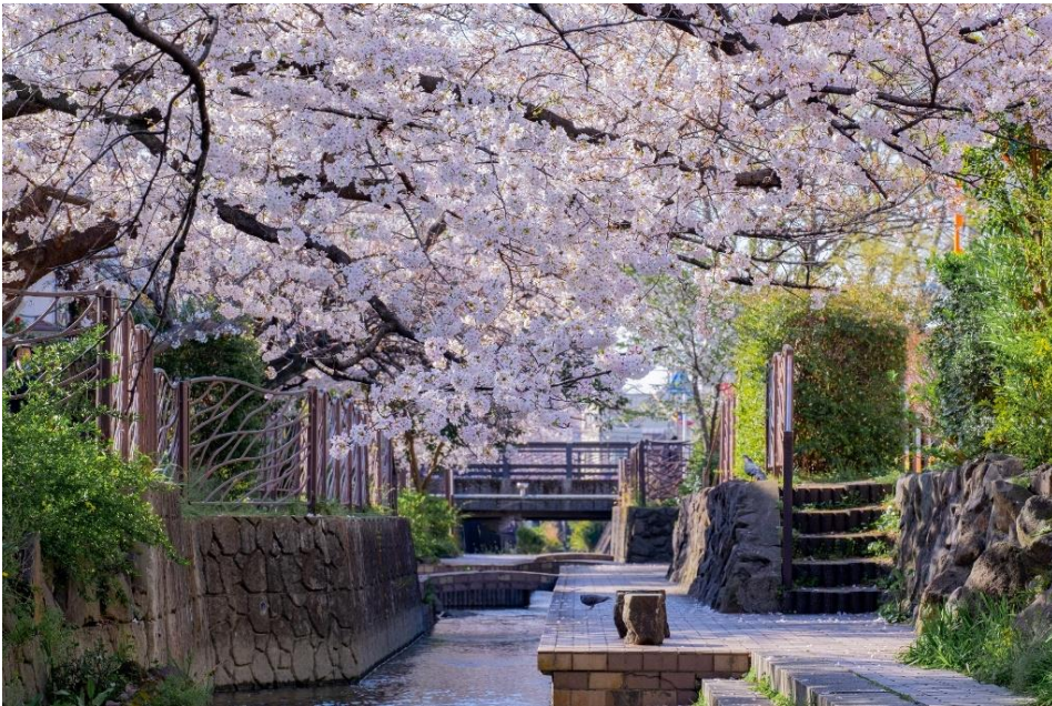
公開している写真