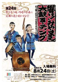
前回のチラシデザイン

夏の一大イベントのイラストを大募集。採用されたイラストは告知のチラシや当日のプログラムなどに掲載します。採用者には図書カード3千円分をプレゼント。応募作品はイベント当日に全作品展示します。