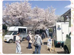
緑化センター桜まつり