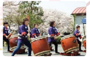
多摩川桜のコンサート