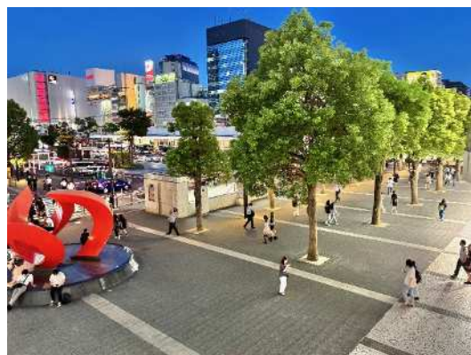
かわさきフェス広場 (川崎ルフロン前)