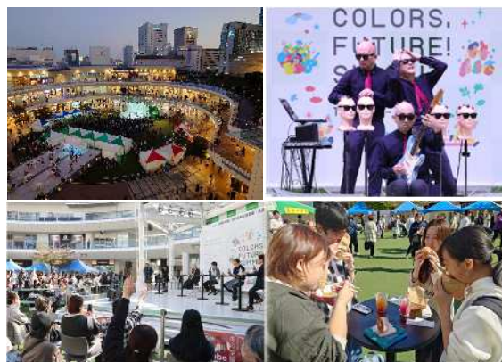
昨年度のフェスティバルの様子