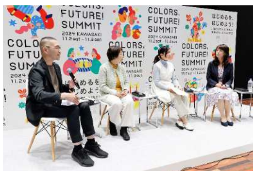
市役所 2 階ホール会場