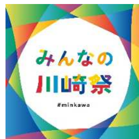
みんなの川崎祭のロゴマーク