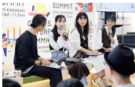
UNI COFFEE ROASTERY 会場