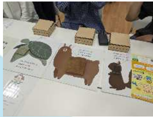
動物の毛や呼吸を体感