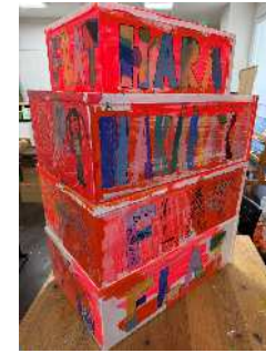
廃棄物活用アート