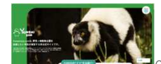
夢見ヶ崎動物公園非公式HP