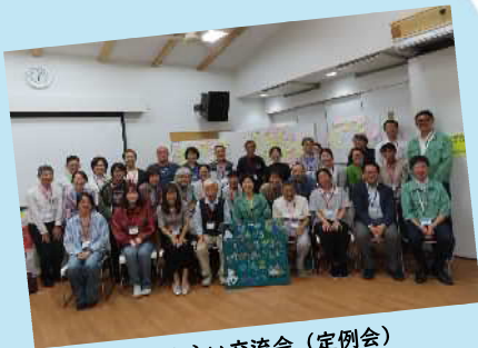
ゆめみらい交流会 (定例会)