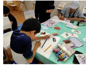
絵画ワークショップ