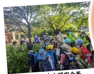
夏休み自由研究企画