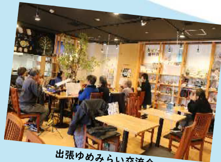
出張ゆめみらい交流会