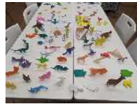
動物おりがみ教室