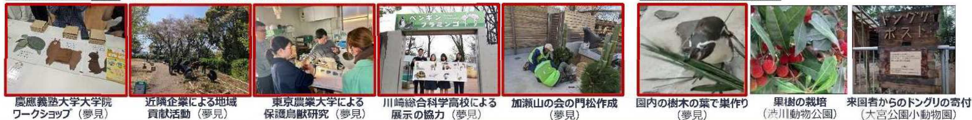
慶應義塾大学大学院 ワークショップ (夢見)