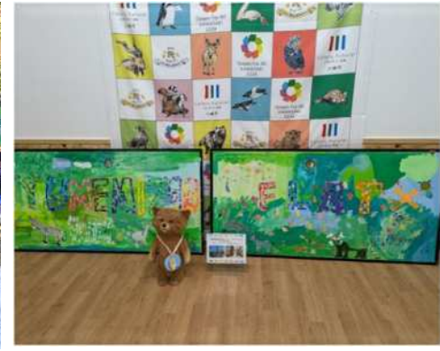
studioFLATが旧事務所の一部を再利用して記念品を制作

多様な主体が関わることで、 団体間交流 ・ 世代間交流 ・ 国際交流 が生まれています！