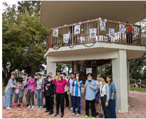
交流会メンバーでハロウインの飾りつけ