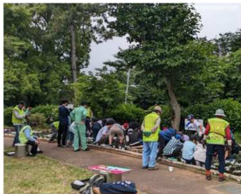
加瀬山の会主導のもと保育園児、小学生による花壇製作

多様な主体が関わることで、 団体間交流 ・ 世代間交流 ・ 国際交流 が生まれています！