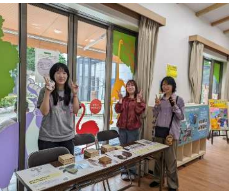
はたらくらす×慶應義塾大学留学生の コラボワークショップ