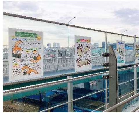
交流会メンバーで新川崎駅ご線歩道橋へポスター・写真を展示