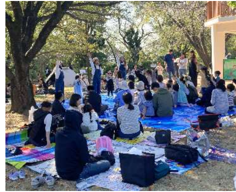
動物園まつりにゆめみらい交流会ブースを出展し、ライブやかるたなどを実施