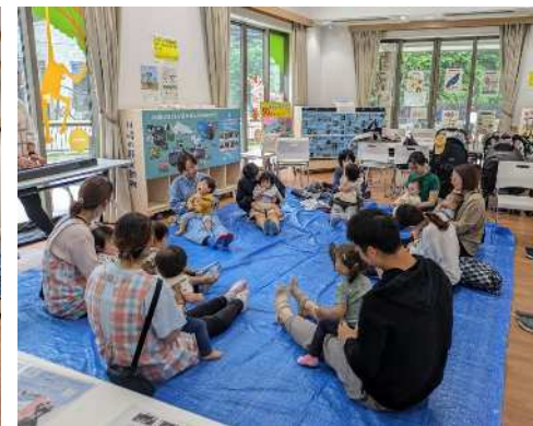
パークセンターで保育園がリトミックを開催