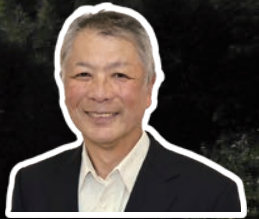
岡上西町会 二宮会長