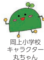
岡上小学校 キャラクター 丸ちゃん