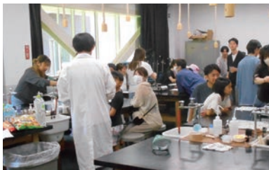
こどもサマーカレッジの様子

鶴見川での環境学習などを行う「こどもサマーカレッジ」やアニメ・漫画を学問の目で読み解く「おかがみサブカル・カレッジ」などの連携事業を行っています。また、3月には岡上町内会・岡上西町会が毎年開催する「おかがみふれあいまつり」に合わせ、理科実験などを行う「こどもサイエンスカレッジ」を開催します。