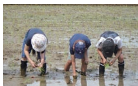
田植えをする5年生

3年生では岡上で納豆の製造をしている「カジノヤ」協力のもと大豆の栽培、5年生では地域の協力のもと営農団地の一角で米作り、6年生は丸山(里山)保全活動など、岡上の豊かな自然を生かした体験活動を行っています。