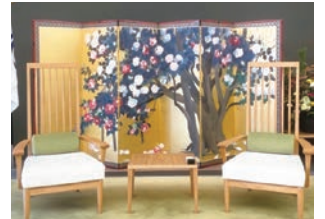
市長応接室に飾られている「大樹・五色八重咲散椿図」

3月に90歳を迎えますが、創作意欲は尽きることなく、「美術や音楽は人の心を育てるもの」という思いから、「今後は出前教室などを通じて、麻生区の子どもたちに絵を描く楽しさを伝える機会をつくりたい」と語ってくれました。