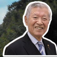
岡上町内会 宮野会長