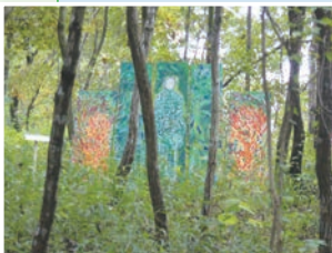
サトヤマアートサンポ 2025

貴重な草花が自生する雑木林で、区の花ヤマユリの植栽保全地でもあります。毎年11月には、和光大学芸術学科の学生が地域のひとと協働し、緑地や農地などに作品を展示する「サトヤマアートサンポ」を開催しています。