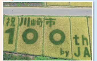
市制100周年記念事業 田んぼアート

岡上の面積の約4分の1に当たる約35haの広さがあり、一年中野菜や米、果物が栽培されています。柿もぎ・たけのこ掘り・ブルーベリーの摘み取りなども体験できます。