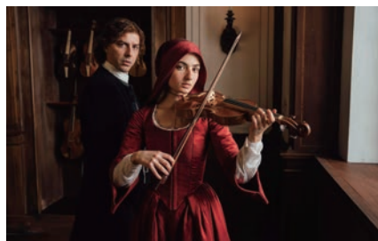
©2025 INDIGO FILM, WARNER BROS. ENTERTAINMENT ITALIA, MOANA FILMS

◎『ヴィヴァルディと私』…18世紀初頭のベネチアに実在した音楽施設ピエタ院を舞台に、作曲家アントニオ・ヴィヴァルディと孤児の少女の絆と成長を描く人間ドラマ。◎5月23日～6月12日。