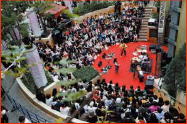
川崎区・ラキッタテッラ中央噴水広場でフリーライブ