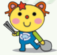
かわさき3R推進キャラクター かわるん