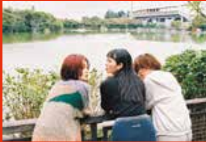
中原区・等々力緑地でスタジアムを眺む