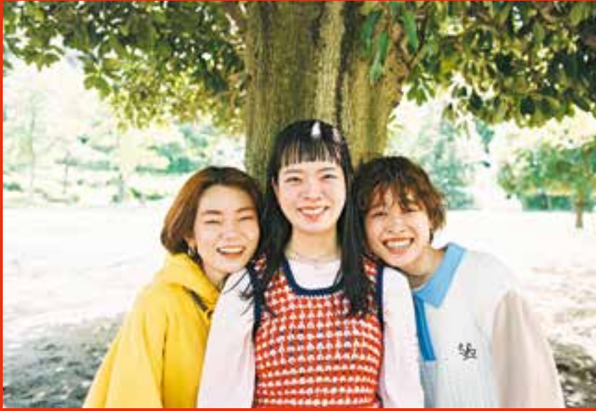
多摩区・生田緑地内の広場で