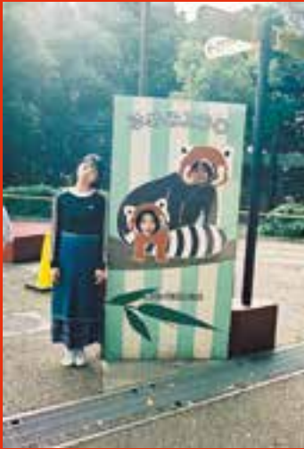
幸区・夢見ヶ崎動物公園でポーズ