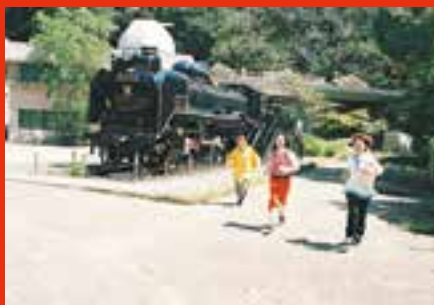
多摩区・生田緑地の名物、蒸気機関車と