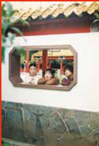
川崎区・瀬秀園にて