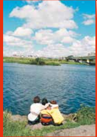
多摩区・多摩水道橋近辺の多摩川河川敷で