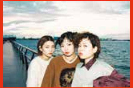
川崎区・東扇島公園で海をバックに