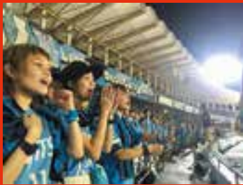
中原区・Uvance とどろきスタジアム by Fujitsuで川崎フロンターレを応援