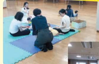
高津市民館「キューピーランド」