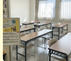
自主学習スペースの提供