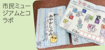
市民ミュージアムとコラポ