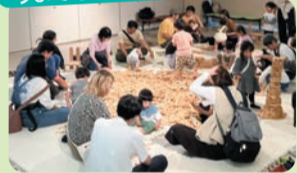
親子で木に親しむ