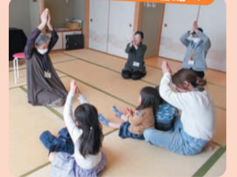
和室でおはなし会