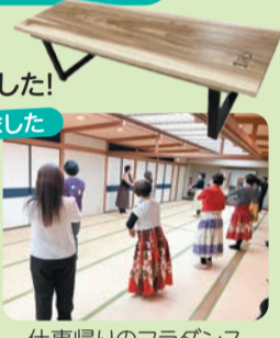
仕事帰りのフラダンス