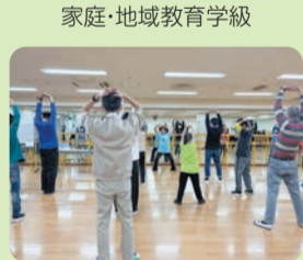
家庭・地域教育学級