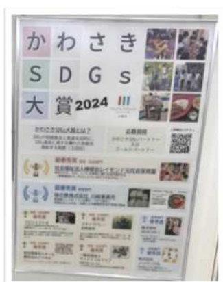
イベントでの パネル展示