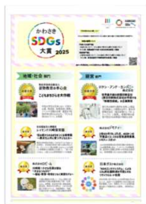
PRリーフレット 作成・掲載

受賞者には、賞状（最優秀賞、優秀賞）及び盾（最優秀賞のみ）が贈られるとともに、PRリーフレットの作成・掲載、市HPへの掲載のほか、かわさきFM、市主催イベントにおける事例発表など、受賞者のSDGs取組を発信する機会が提供されます！