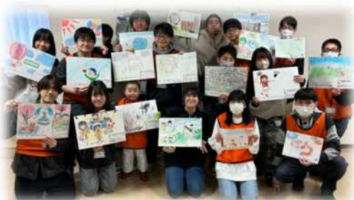
理想の公園、理想のイベントの絵