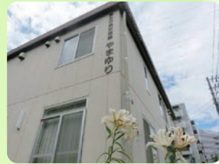
麻生市民交流館やまゆり

市民活動支援の拠点施設としてボランティアが運営し、活動の場や情報の提供、人材や資金のサポートを行っています。詳細は同館HPで。