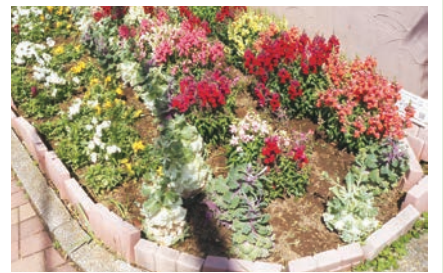
写真はイメージです。花材が異なる場合があります。

申問 6月26日(消印有効)までに申込書に花壇の所在図、見取り図、花壇の写真や管理の根拠が確認できるもの(協定書コピーなど)の5点を直接、郵送、メールで区役所地域振興課 ☎044-556-6606 FAX044-555-3130 E63tisin@city.kawasaki.jp [抽選]。 ※申込書は区役所で配布中。区HPからもダウンロードできます。