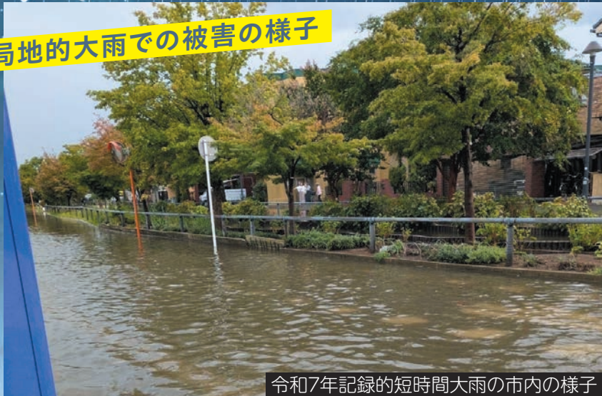
令和7年記録的短時間大雨の市内の様子

梅雨を迎え、これからの季節は台風だけでなく、局地的に大雨が降ることにも注意が必要な時期です。多摩川と鶴見川に囲まれた幸区では、大雨に被災する可能性がありますので、いつ豪雨に見舞われても問題ないように、被害を防ぐための事前の備えが大切です! 避難先や情報の確認方法を家族で共有し、落ち着いて行動できるよう準備しておきましょう。