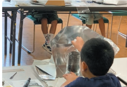
ミニソーラークッカー作り