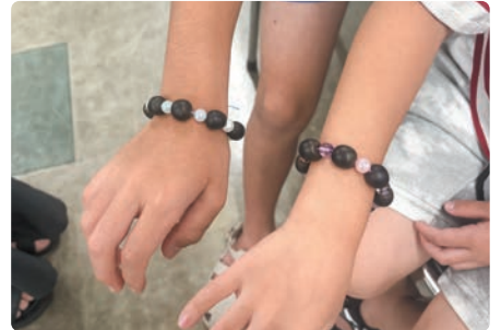
ムクロジの実でプレスレット作り