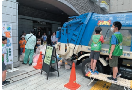
ごみ収集車の中が見えるスケルトン車