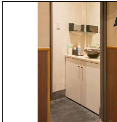
車いす対応トイレ無し