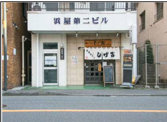
駅からのアクセス：JR「川崎」駅東口より約750m