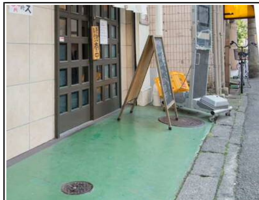
扉の納まり段差（1cm）以外に段差無し。