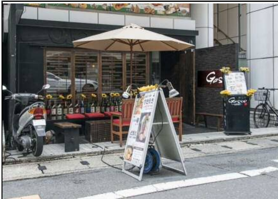
駅からのアクセス：駅前ペDESTリアンデッキ側のエレベーターで1Fへ降り、約450m