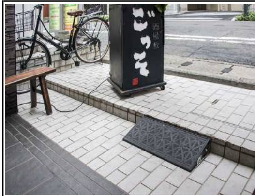
建物の入り口に、縁石を含む段差が2段