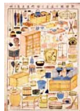
遊芸小間物道具展

【URL】 http://www.kawasaki-museum.jp/display/exhibition/exhibition_de.php?id=248