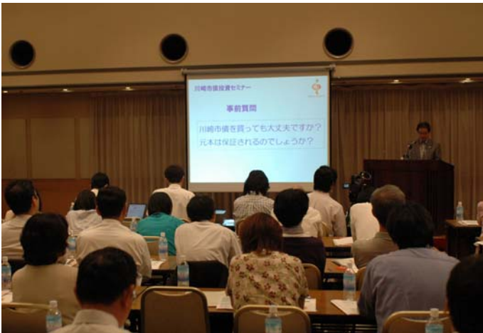
<阿部市長による説明>