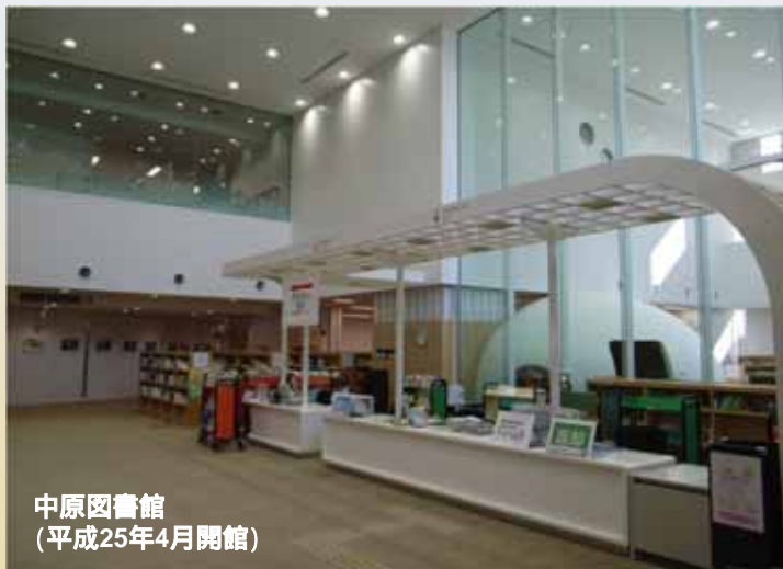
中原図書館 (平成25年4月開館)