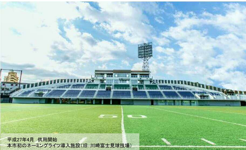
平成27年4月 供用開始 本市初のネーミングライツ導入施設（旧：川崎富士見球技場）