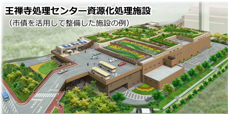
王禅寺処理センター資源化処理施設