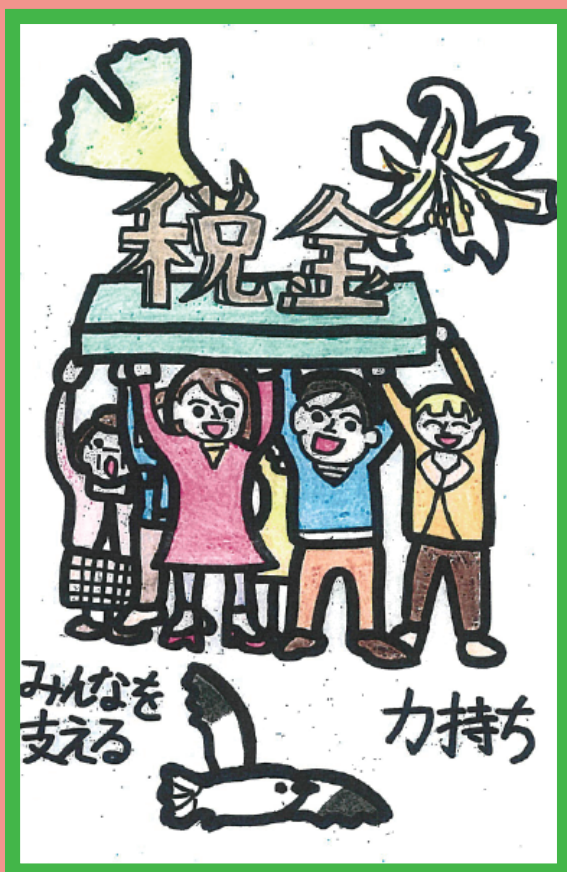
川崎南税務署長賞 東大島小学校