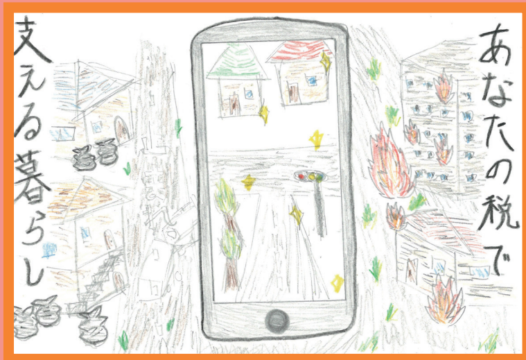
川崎西税務署長賞 宿河原小学校