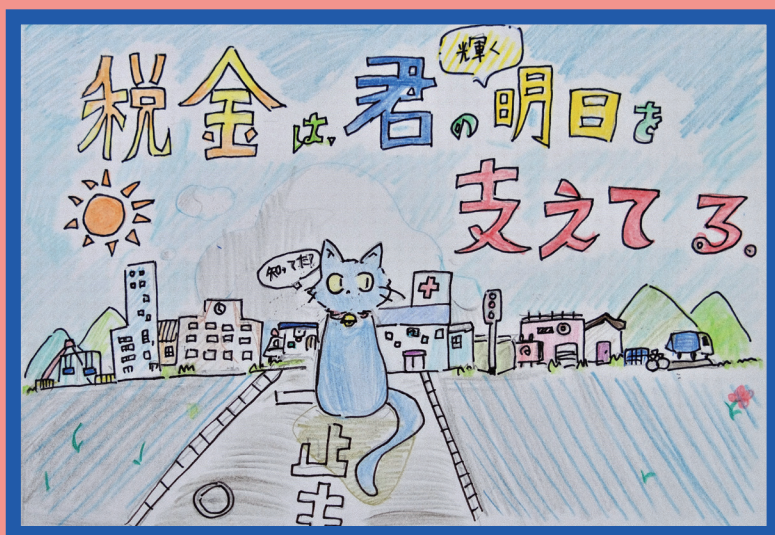
川崎北税務署長賞 鶴沼小学校