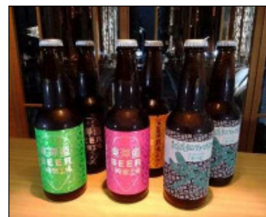
東海道 BEER 川崎宿工場/クラフトビール