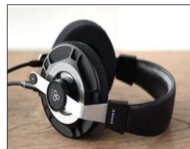
SNEXT/final 平面磁界型ヘッドホン