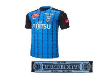
川崎フロンターレ/2020応援パック

https://furu-po.com/lg_goods_list.php?id=141305#intro