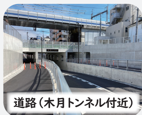
道路 (木月トンネル付近)