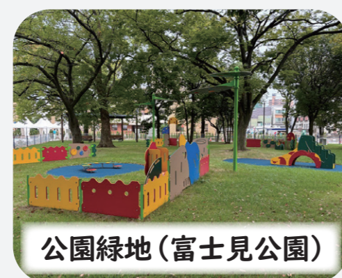
公園緑地 (富士見公園)