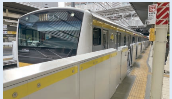
ホームドア設置例 (JR南武線武蔵小杉駅)