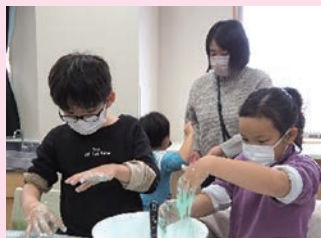
③ 学校を活用した子ども向け体験講座の様子