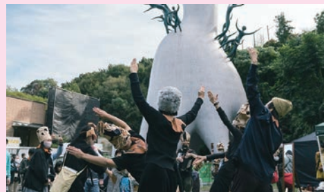
② 令和4年度 アート・フォー・オール推進モデル事業の様子