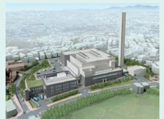
橋処理センター(イメージ)