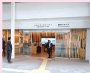
④ 2019年度「ステキな施設の認定案内所」に選ばれた「かわさき きたテラス」