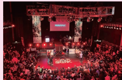
① INTERNATIONAL STREET FESTIVAL KAWASAKI 2022 SUPER BREAKの様子