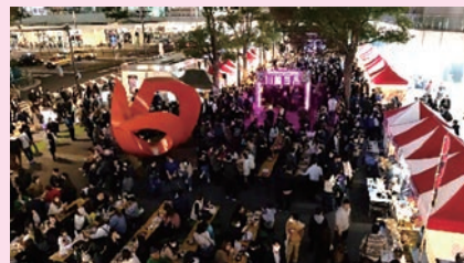
⑤ ナイトマーケット「川崎夜市」