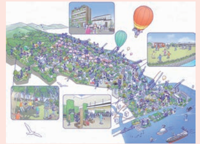
緑化フェア：全市展開のイメージ図