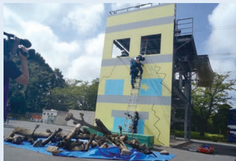
総合防災訓練の様子