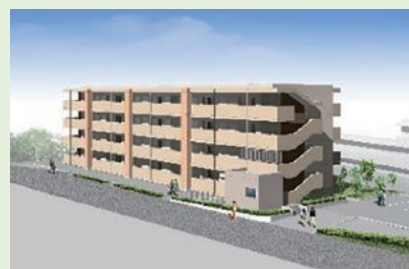
市営住宅完成イメージ