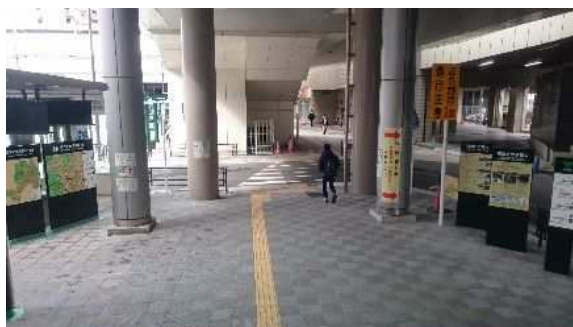
① J R側