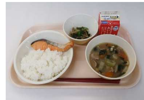
能登食材を使った学校給食

今後も被災地に寄り添いながら、市民等の皆様に「寄附して良かった」と思っていただけのような支援を行っていきます。