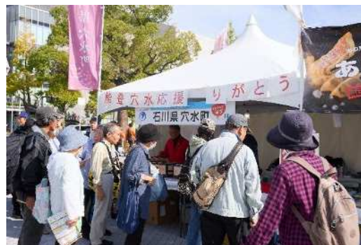
第46回かわさき市民祭り物産販売の様子