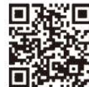
認証キーの取得方法 発注者への提出方法