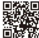
電子保証の仕組み