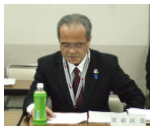
報告する大下区長

このほかにも、事業提案制度の構築や区ホームページへの区長の日記などの掲載、地域ポータルサイトの開設と運営、団塊の世代に向けた「よろずシニア本舗・みやまえ」の設置など、暮らしやすい地域社会の形成に、積極的に取り組んでいます。