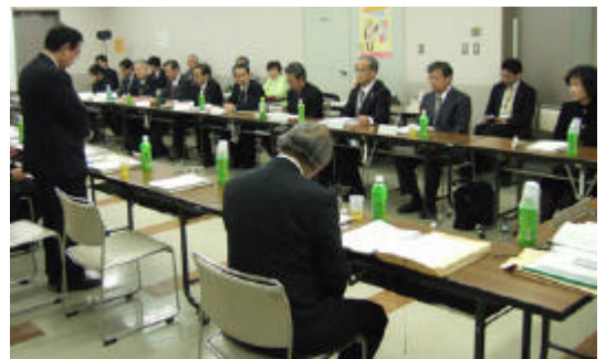
あいさつする市長と出席者

区民会議は、地域社会の課題を把握し、解決を図るための方針及び方策などを審議する機関(区民会議条例第3条)であり、区域内の活動団体からの推薦や公募、区長推薦の計20名以内で構成されます(同第4条)。区長は区民会議の審議結果を尊重し、区民との協働、関係機関との連携により、暮らしやすい地域社会の形成に努めます(同第10条)。