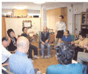
大戸地区のすこやか活動