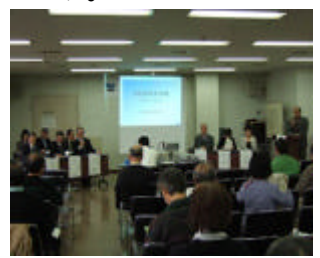
宮前区民会議フォーラム