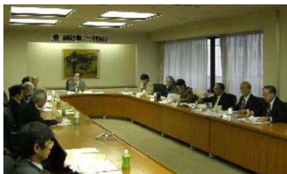
策定委員会の様子