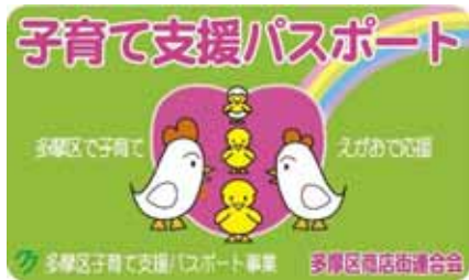
子育て支援パスポートカード 裏面に子ども氏名と生年月日を記入して 使用（差し支えない範囲）