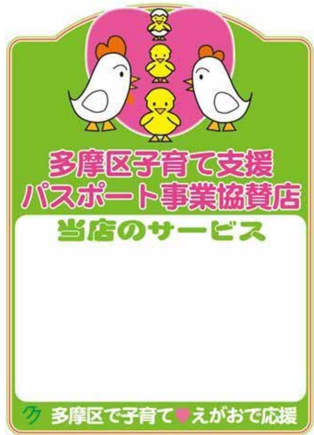
店頭ステッカー サービス内容を書き込める