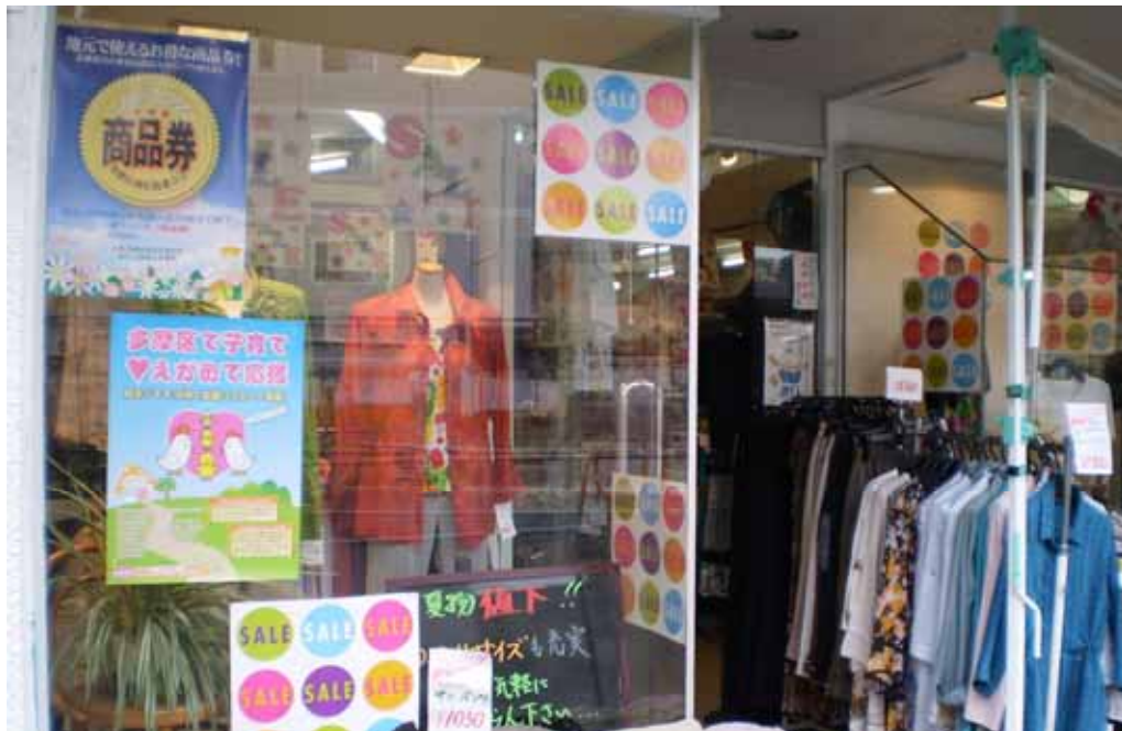
ポスター 協賛店の目印として店頭表示