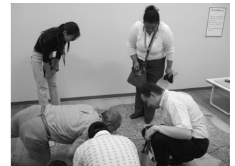
오래된 지도에서 가와사키의 과거 모습을 살펴봄

가와사키시 박물관에서는 에도 시대부터 오늘날까지의 지형도를 비교하며 가와사키의 과거 모습을 살펴보았습니다. 참여자들이 현재 자신들의 집의 위치가 오래된 지도에서는 어디쯤인지 묻자, 큐레이터가 참여자들의 땅이 당시에 어떤 모습이었는지 설명하였습니다.