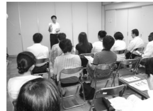
가와사키 후레아이 홀 (후레아이 칸) 시설 및 사업 소개

뒷편에 있는 방에는 외국인들에 대한 자료가 많이 있었습니다. 스크랩한 신문과 책들이 책장에 보기 좋게 정돈되어 있었습니다. 이 자료들이 앞으로 우리에게 유용할 것이라 믿습니다.