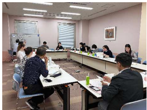
あんしんせいかつぶかい 安心生活部会