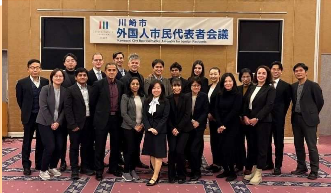
ねん がつようか にち だい き がいこくじんしみんだいひょうしゃかいぎ ねんどだい かいだい にち しゅうこうしゃしん 2026年2月8日（日）第15期外国人市民代表者会議2025年度第4回第2日 集合写真