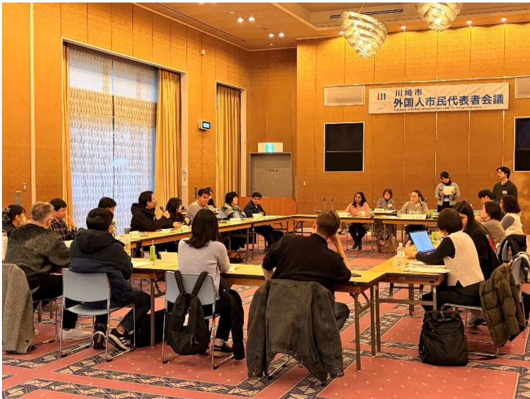
ぜんたいかい ようす 全体会の様子

かくいんかい かつどう かくしゅかつどうじようきよう さんしやう (各委員会の活動については、Ⅲ 各種活動状況 2 3 4 を参照)