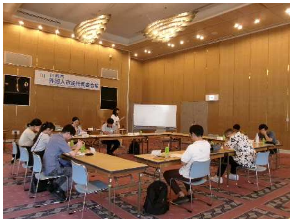
たぶんかしゃかいぶかい 多文化社会部会