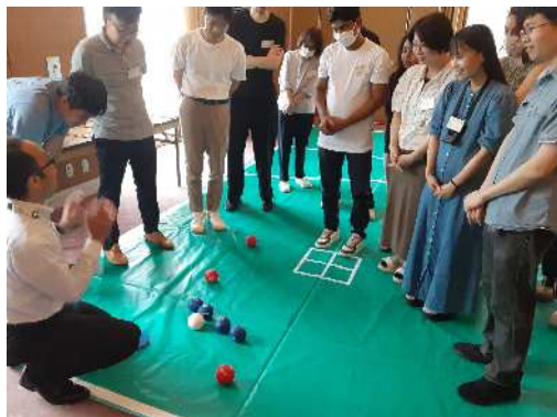
【説明を受ける代表者】

②ポッチャを体験し奥深さと楽しさを実感しました。事前練習と作戦を考えて参加するとさらに面白くなりそうです。この感想が参考になれば幸いです。