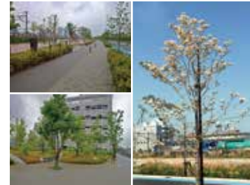
新たに整備された気持ちのいい緑道

鹿島田跨線橋から三菱ふそうの工場横までの約1kmの道は、両側に二百数十本のハナミズキが植えられていて、気持ちの安らぐ素晴らしい景観です。この道は旧鶴見操車場の再開発に合わせて新たにできました。歩道の幅が広く歩き易いつくりになっているので、のんびりとした散歩ができます。