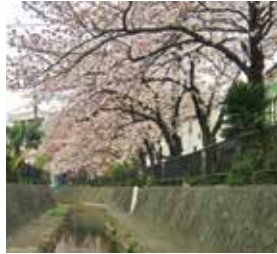
サクラの季節がオススメです

朱印橋から久地にある円筒分水まで続く「ニヶ領用水・川崎堀」は、鳥や魚の絵が描かれたフェンス、水路に覆いかぶさったサクラ、そして水際には地元の人達によるアヤメが咲き、鴨の姿も見られる絶好の散歩スポットです。特に、春には見事なサクラを楽しむ姿が見られます。