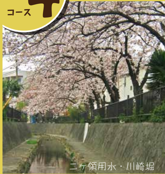
ニヶ領用水・川崎堀