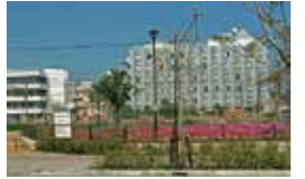
小さな公園に大きな楽しみ

小さな公園ですが、汽車型の遊具があって、子どもたちに大人気です。また、隣接する小緑地には芝さくらが群生していて、春には素晴らしい景観が生まれます。