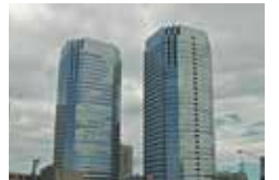
遠くからも目に入るビル

31階建て、高さ134mのツインビルは、新川崎地区のランドマーク。国内の大手企業がオフィスを構えているインテリジェントビルです。館内のアトリウムには椅子とテーブルが配置されていて、館内の店舗からテイクアウトして飲食することができます。