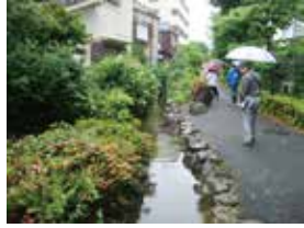
小さなせせらぎが昔の名残り

「ニヶ領用水・大師堀」は、かつて、大師河原や渡田方面の水田を潤した用水路で、昭和14年から49年までは工業用水としても利用されていました。「川崎堀」から鹿島田橋の駅寄り、南武線と交叉する付近で「町田堀」と分かれ、小さなせせらぎとなり、サウザンドシティの東側を流れ、下平間小学校付近まで到達します。