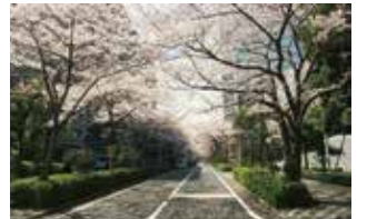
見事なサクラ並木が道を覆う

旧日立製作所川崎工場の跡地に開発された「パークシティ新川崎」と「新川崎三井ビルディング」の間の通りは、春に“さくらのトンネル”となり、多くの見物人が集まります。この道の中央西側にある歩道橋上から眺めると、また異なったサクラの景観が楽しめます。