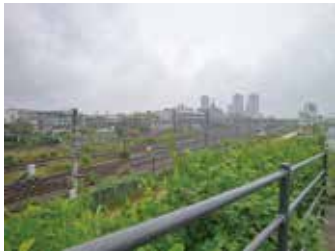
つぎつぎ通る電車や貨物線