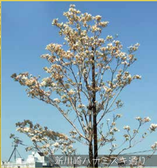
新川崎ハナミズキ通り