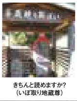
きちんと読めますか? (いは取り地藏尊)