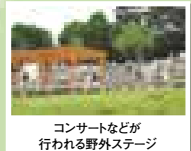
コンサートなどが 行われる野外ステージ