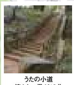
うたの小道 懐かしい歌が10曲