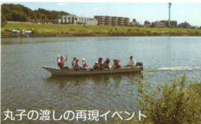
丸子の渡しの再現イベント

中原街道を通る人々にとって、昭和10年に丸子橋が完成するまでは渡しや川を渡る唯一の交通機関でした。数多くあった多摩川の渡しの一つでした。渡し場の近くに松原・青木根集落がありましたが大正9年の築堤で姿を消しました。