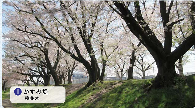
① かすみ堤 桜並木