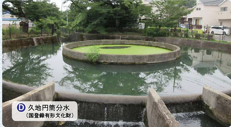
④ 久地円筒分水 (国登録有形文化財)