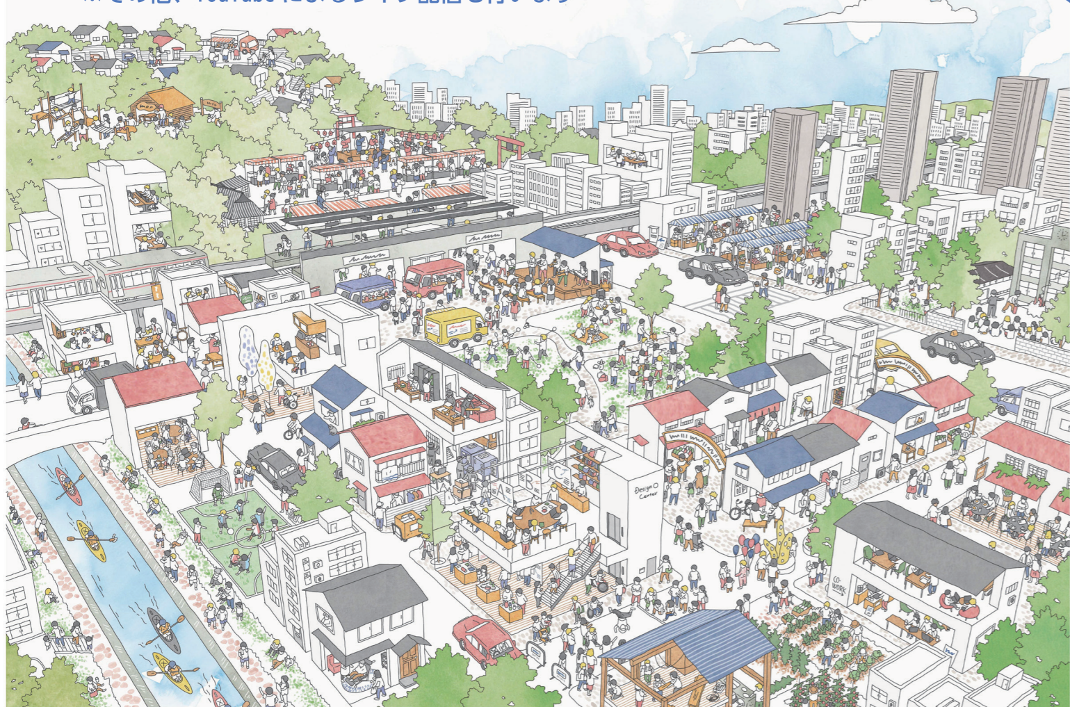
イラスト：イナデザイン