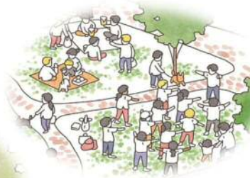
公園で朝の体操活動をはじめたい… どこかに手続きが必要なのかな？