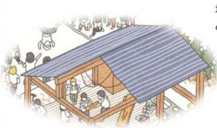
古民家をみんなでDIYしてみたい… まず何からはじめればいいのか？