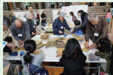
市民ミュージアムでのワークショップの様子