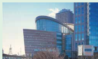
ミュージア川崎シンフォニーホール