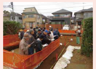
橋樹官衙遺跡群（橋樹郡家跡 第28次調査）現地見学会の様子