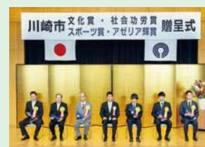
川崎市文化賞等贈呈式の様子