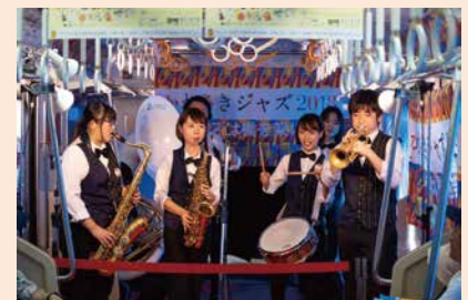
かわさきジャズの様子 (京急ステーションバルトレインステージ)

市内には、2つの音楽大学と日本で唯一の映画の単科大学という文化芸術系の大学、NPO法人、文化団体、文化芸術活動に取り組んでいる企業等、様々な活動主体があります。今後も相互の情報の共有化を進め、これら活動主体や行政が連携した総合的な文化芸術活動の推進を図ります。