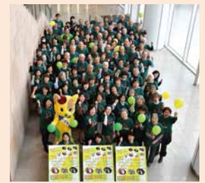
川崎・しんゆり芸術祭 (アルテリッカしんゆり) アートボランティアの皆さん