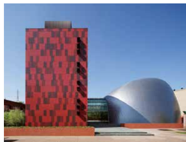
洗足学園音楽大学