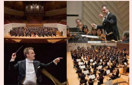
本市のフランチャイズオーケストラである東京交響楽団による演奏