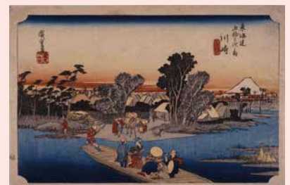
浮世絵（東海道五拾三次之内川崎六郷渡舟）