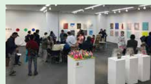
アート展「colors かわさき展」の様子