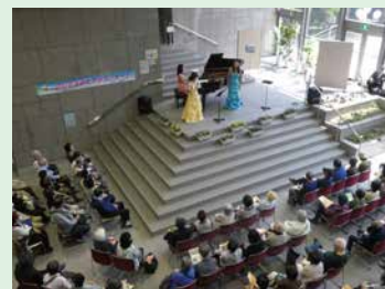
市役所庁舎でのコンサートの様子