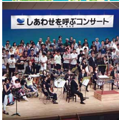
しあわせを呼ぶコンサート