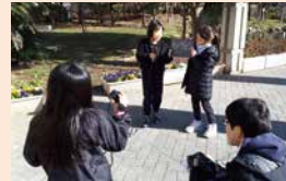
映像制作ワークショップの様子

文化芸術活動を行う人材や、活動を支える人の育成を進めるとともに、その活躍の場を広げていくことにより、文化芸術を地域で支えていく取組を推進していきます。また、次世代を担う子どもや若者が身近に文化芸術に触れることができる環境を充実することにより、地域の文化芸術を支える人材を育てていきます。